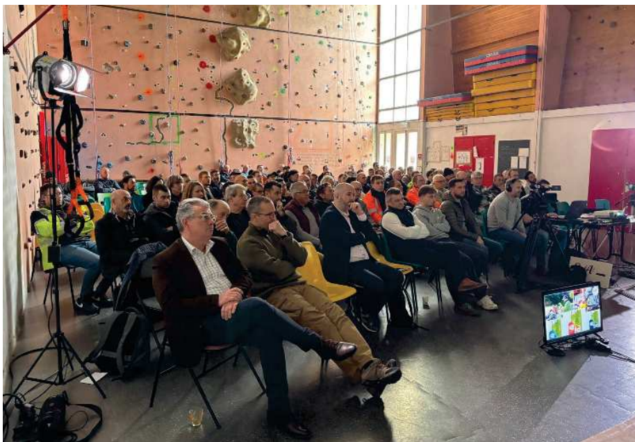
MATÉRIEL ET PAYSAGE