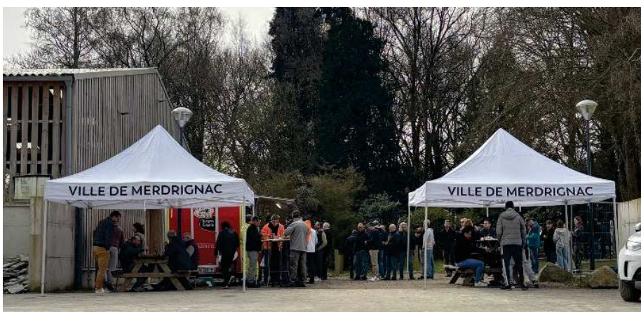
MATÉRIEL ET PAYSAGE