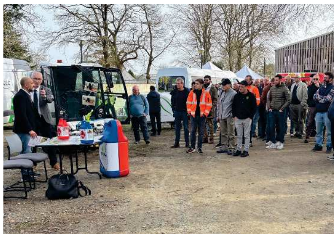
Après les conférences, les visiteurs sont tous passés sur les stands des partenaires au moins une fois en groupe (ici chez Aspen).

vie scolaire proposant de nombreuses animations et des pédagogies actives. L'association sportive particulièrement dynamique, notamment avec le futsal et le badminton, constitue un vecteur pour fédérer les jeunes et permet aussi de travailler sur leur capital santé (1) . Une bonne ambiance nécessaire sachant que la moitié des élèves sont internes. « En lien étroit avec les besoins et les activités des territoires sur lesquels nous sommes implantés, nous proposons des formations pour